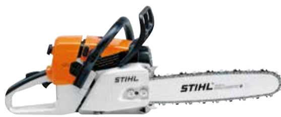
Motosserra STIHL MS 361

A STIHL convoca os usuários das Motosserras MS 361 fabricadas entre 23 de fevereiro de 2021 e 15 de fevereiro de 2024 , identificadas pelos números de série 370220489 a 373203178 , a interromperem o uso imediatamente.