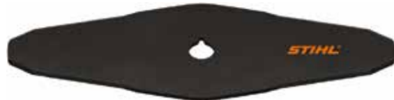
Lâmina de 2 Pontas 305-2 Especial

A STIHL convoca os usuários de Lâmina de 2 pontas 305-2 especial, fabricadas entre 28 de fevereiro de 2024 e 25 de março de 2024 , identificadas pelos números de lote 31262, 31269, 31271 e 31275 , a interromper o uso imediatamente .