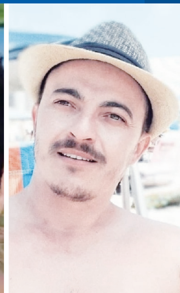
Vítimas de serial killer demonstravam amor pela vida e humor nas redes sociais.